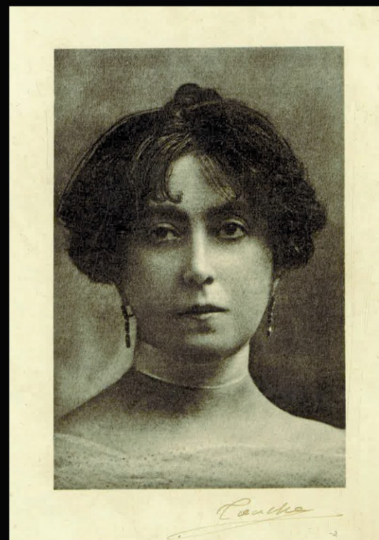
Concha Espina (1869-1955). Escritora. Premio Fastenrath (RAE) 1914, por La esfinge maragata .

2014 Centenario del comienzo de la 1ª Guerra Mundial. 75 Aniversario del comienzo de la 2ª Guerra Mundial.