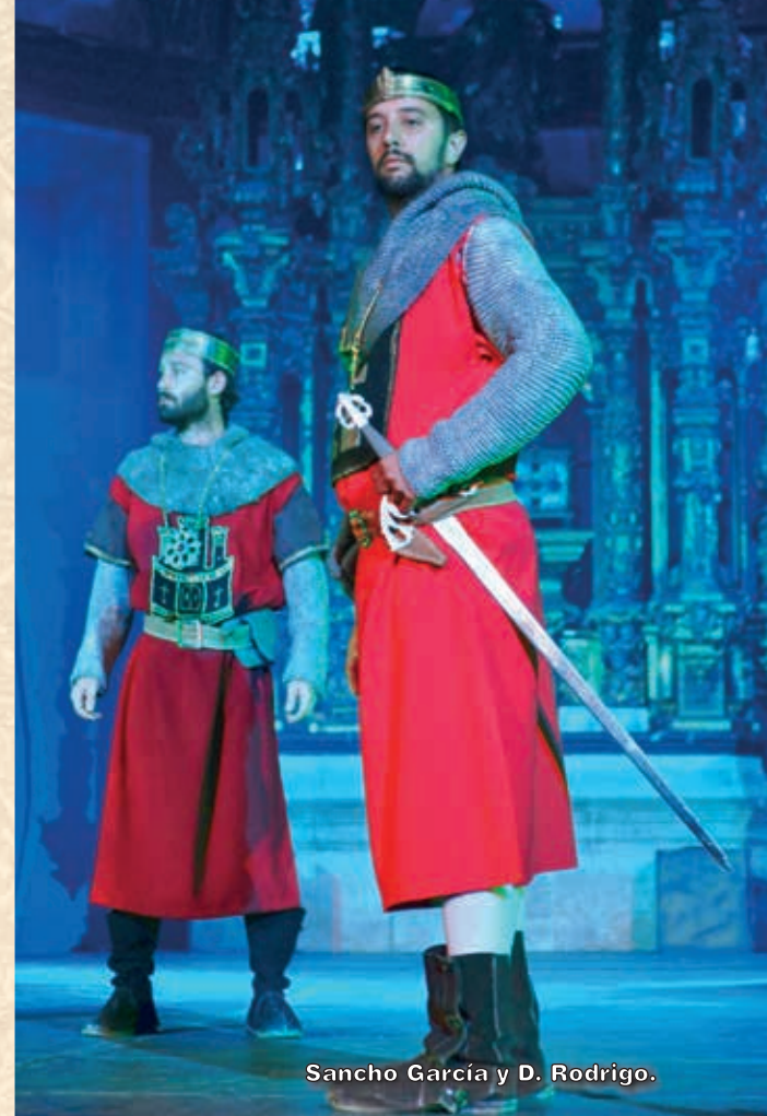
Sancho García y D. Rodrigo.

Su hija Doña Mayor ya es la mujer del Rey Sancho III de Navarra, El Mayor. Otra hija, Doña Sancha lo es del Conde de Barcelona, Ramón Berenguer.