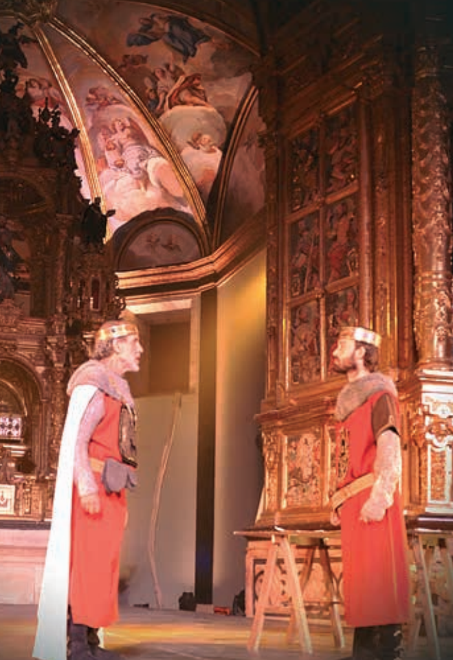
12 Sancho García, el conde de los Buenos Fueros.

El Rey navarro tiene que hacer enormes esfuerzos políticos para ganarse a los castellanos.