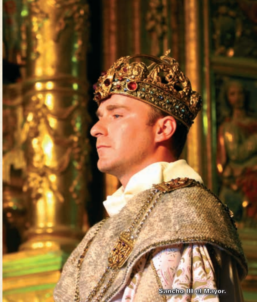
Sancho III el Mayor.