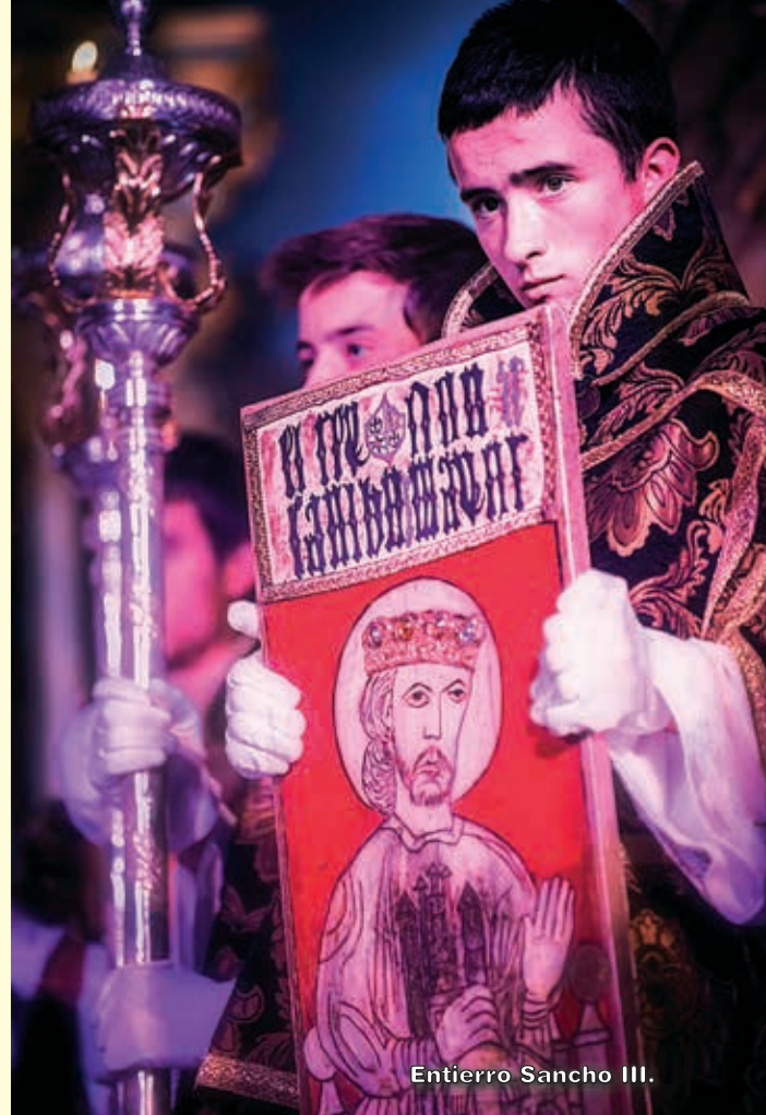
Entierro Sancho III.

El Cronicón ha aportado a Oña una buena dosis de promoción y conocimiento de la