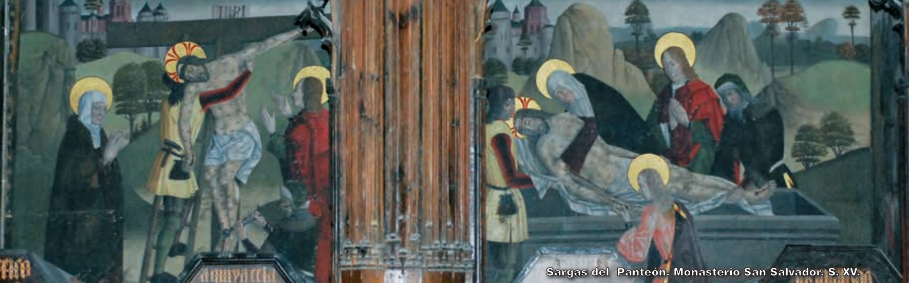
Sargas del Panteón. Monasterio San Salvador. S. XV.

Cuentan las crónicas que el séquito de los castellanos era fastuoso y sus tropas causan admiración por donde pasan.