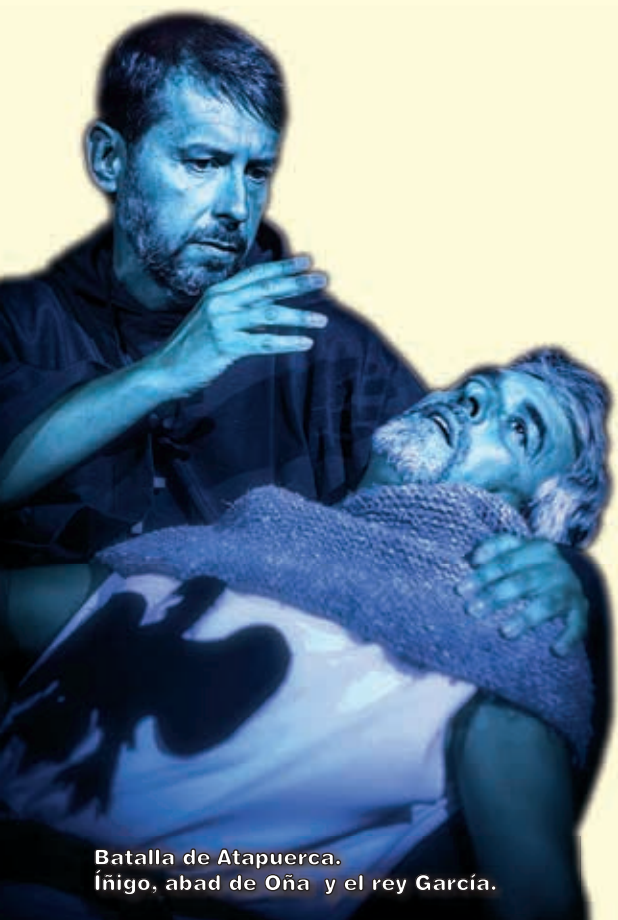
Batalla de Atapuerca. Íñigo, abad de Oña y el rey García.