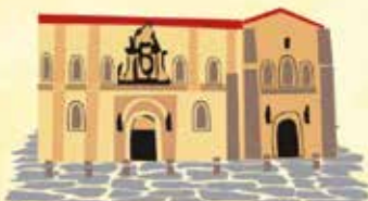
Colegiata de San Isidoro