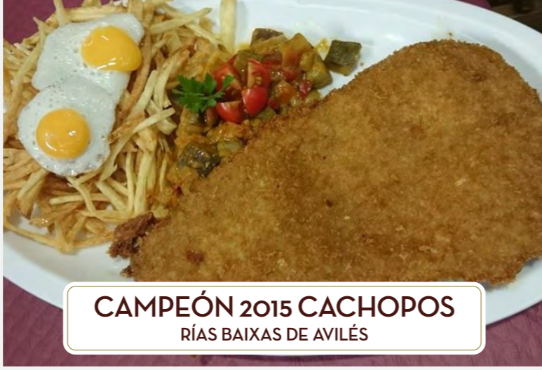
CAMPEÓN 2015 CACHOPOS RÍAS BAIXAS DE AVILÉS