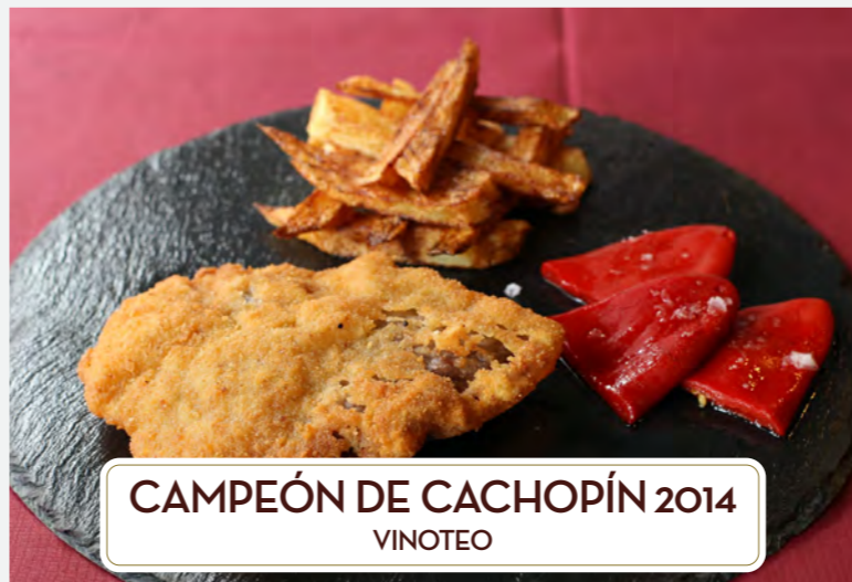
CAMPEÓN DE CACHOPÍN 2014 VINOTEJO