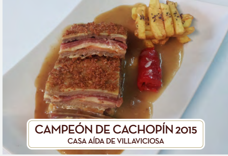
CAMPEÓN DE CACHOPÍN 2015 CASA AÍDA DE VILLAVICIOSA

III CAMPEONATO REGIONAL DE CACHOPOS Y CACHOPINOS DE ASTURIAS Del 12 al 22 de mayo de 2016