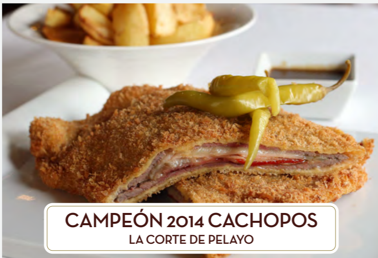
CAMPEÓN 2014 CACHOPOS LA CORTE DE PELAYO