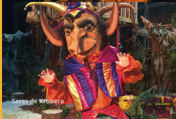
Seres de Krubera