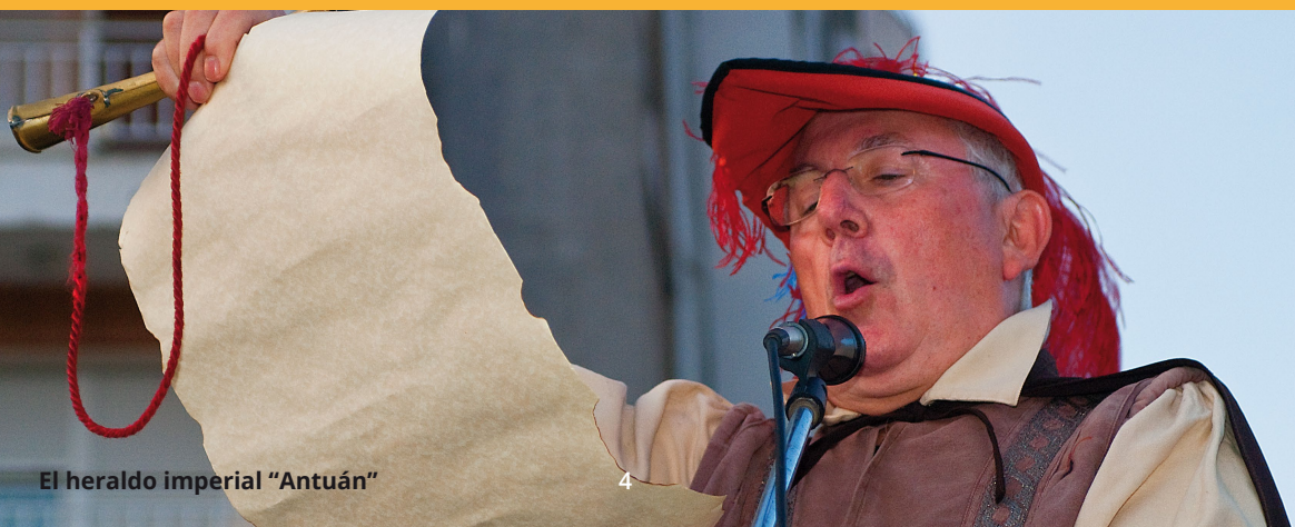
El heraldo imperial "Antuán"