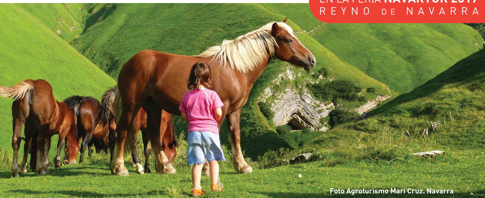
Foto Agroturismo Mari Cruz. Navarra

EN LA FERIA NAVARTUR 2017 REYNO DE NAVARRA