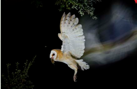
Cazadora nocturna, de Francisco Motilva Peralta