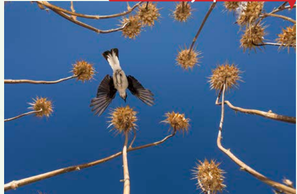
Sobre un bosque de cardos, de José Elías Rodríguez Vázquez