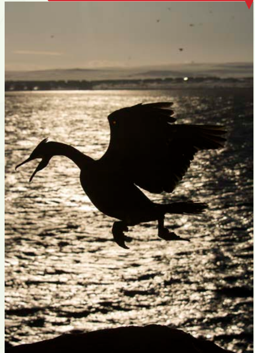
Dragón, de Carlos Pérez Naval