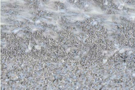
Marea alta, de José Manuel Grandío