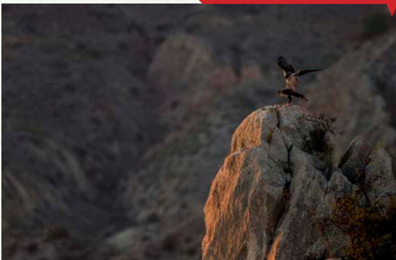
Ocaso en la cárcava, de Tony Peral