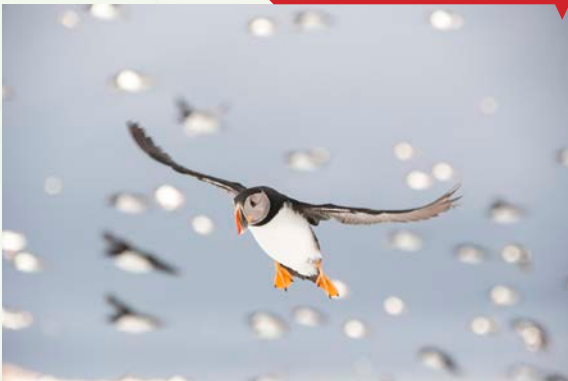
Buscando donde aterrizar, de Rodrigo Pérez Grijalvo