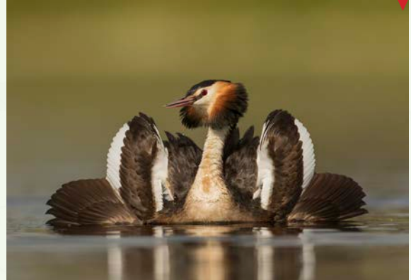
Somurposa, de Sebastián Molano Robledo