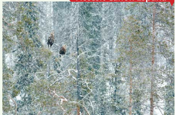
Bajo la nevada, de Andrés Miguel Domínguez Romero