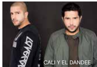
CALI Y EL DANDEE