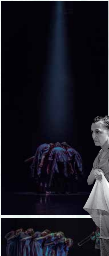
PLATE PROGRAMA ESTATAL DE ARTES ESCÉNICAS

Cuando el espacio público o la justicia eran instrumentos civiles que le concernían al cuerpo.