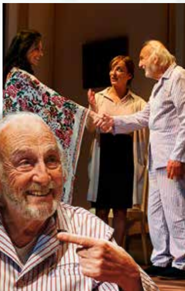
PLATE PROGRAMA ESTATAL DE ARTES ESCÉNICAS

Contar con Héctor Alterio para el papel principal convierte este proyecto en un sueño para cualquier equipo ya que el rigor, la inteligencia, el dramatismo y el sentido del humor están garantizados.