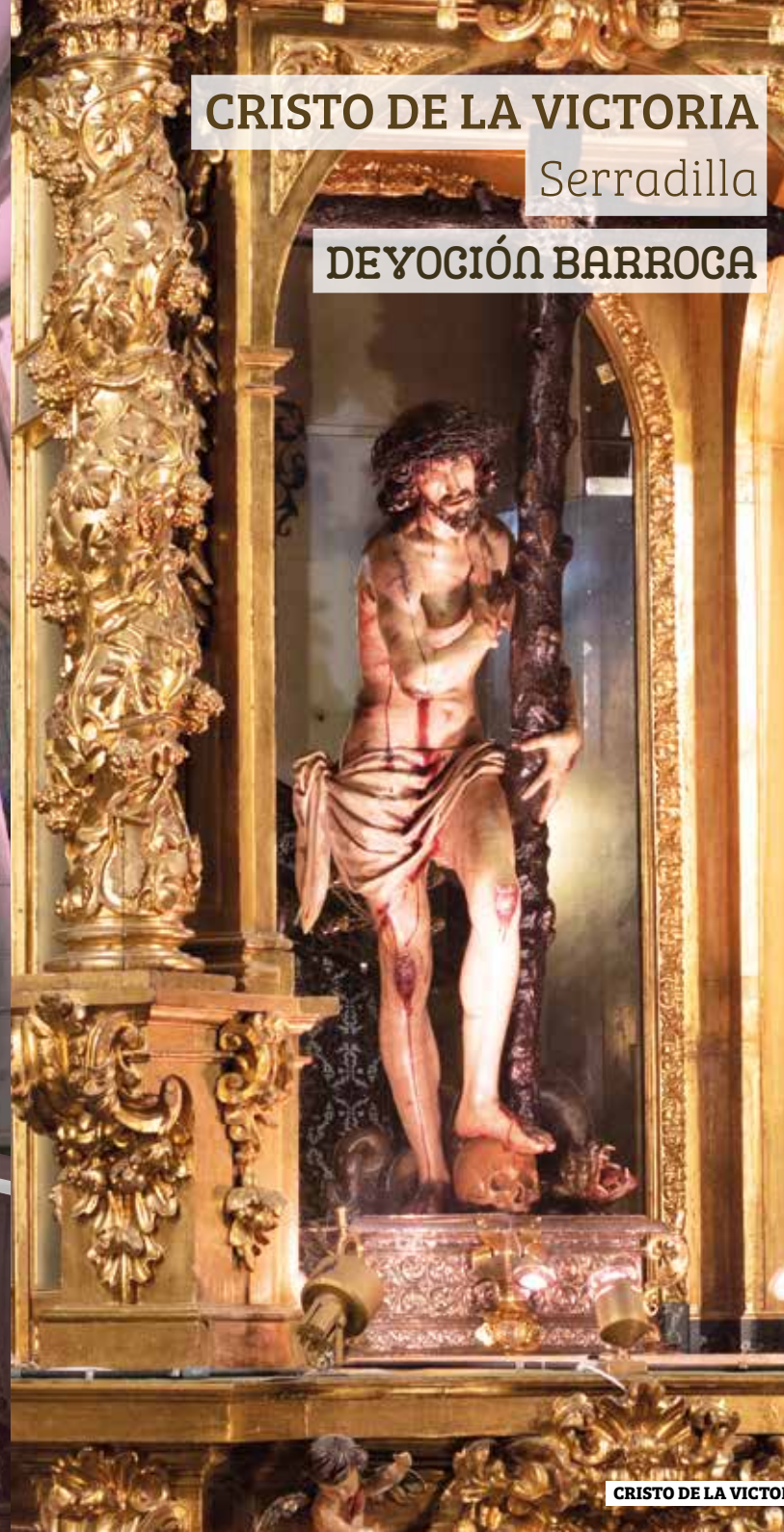
Imagen de tamaño natural tallada en 1630 por el imaginero Domingo de Rioja que se encuentra en el retablo mayor de la iglesia. Se le atribuyen poderes milagrosos y miles son los peregrinos que acuden a visitarlo. El templo que lleva su nombre es barroco de gran belleza y se encuentra en el corazón del Parque Nacional de Monfragüe.

El monasterio del Cristo de la Victoria alberga una de las colecciones pictóricas de los siglos XVI y XVII más importantes del país.