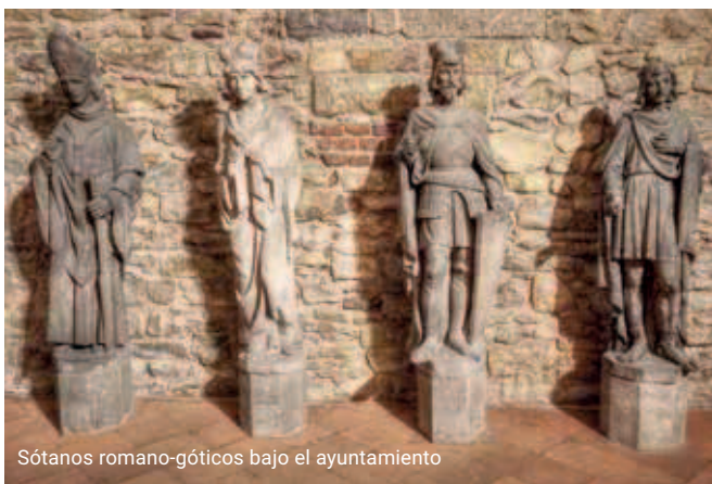
Sótanos romano-góticos bajo el ayuntamiento

La excursión en el Ayuntamiento de la Ciudad Vieja incluye los espacios ocultos bajo el complejo; un intrincado sistema de sótanos romano-góticos más antiguo que el ayuntamiento mismo. Este complejo de salas, corredores y túneles medievales es asimismo el mayor de su tipo en Praga.