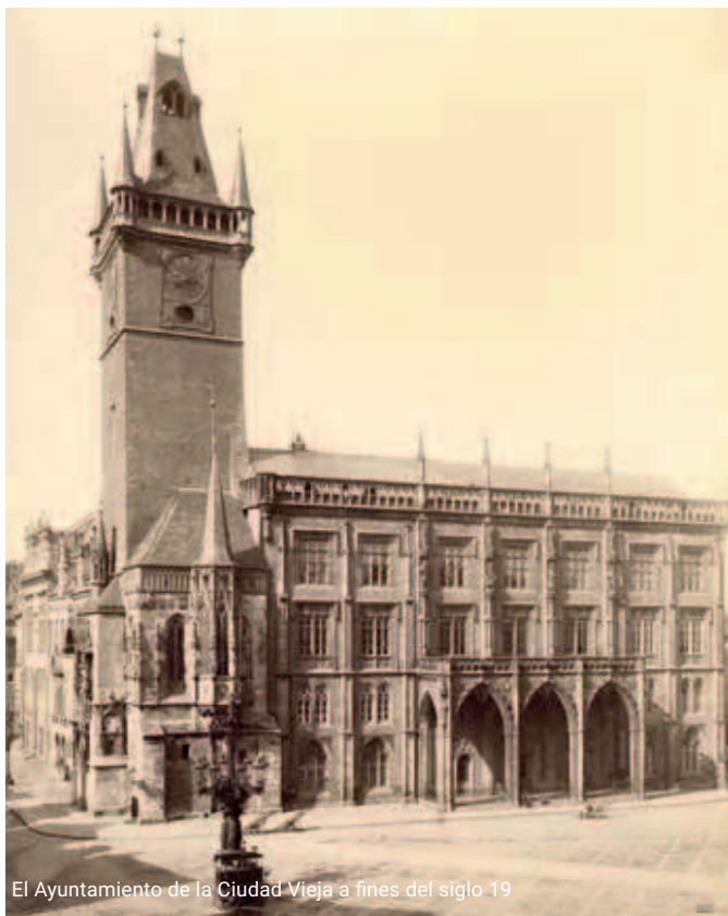
El Ayuntamiento de la Ciudad Vieja a fines del siglo 19

El ayuntamiento jugó un papel importante en más de un evento de la historia de Praga y del Estado Checo. Aquí, Jorge de Podiebrad fue nombrado Rey de Bohemia, y en el patio del ayuntamiento fue ejecutado Jan Želivský, el líder radical de los husitas. Más tarde, fue testigo de la ejecución masiva de los participantes en la Revuelta Bohemia. A fines de la Segunda Guerra Mundial, fue blanco del ataque de los invasores alemanes y una gran parte del él fue destruido completamente.