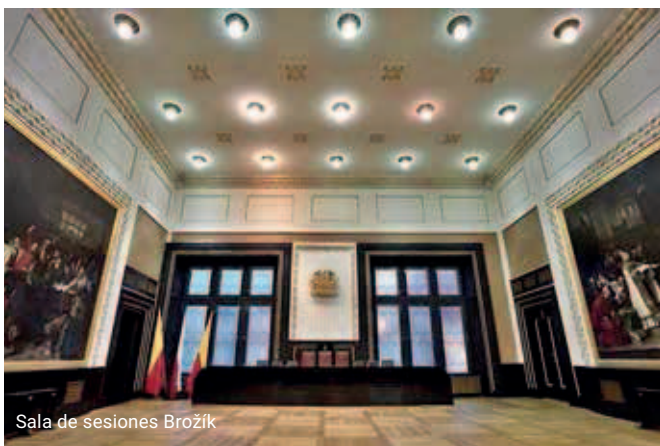
Sala de sesiones Brožík

El salón más grande del Ayuntamiento de la Ciudad Vieja es la Sala de Sesiones , que cubre toda la planta de uno de los edificios y tiene una altura de dos pisos. El adorno más importante de la sala son las dos pinturas de gran tamaño, obra del famoso pintor Václav Brožík, que representan momentos importantes de la historia checa.