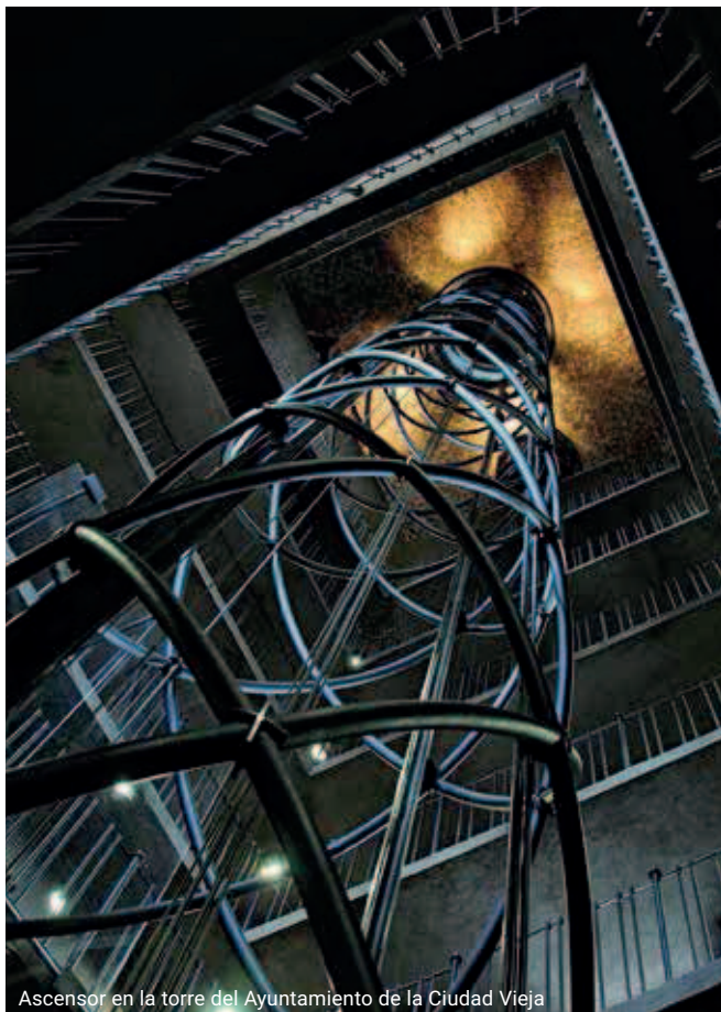
Ascensor en la torre del Ayuntamiento de la Ciudad Vieja

Como la única de las torres medievales praguenses, la torre del ayuntamiento está completamente libre de barreras – hasta la galería lleva los visitantes un moderno ascensor de cristal que ha recibido varios premios por su diseño.