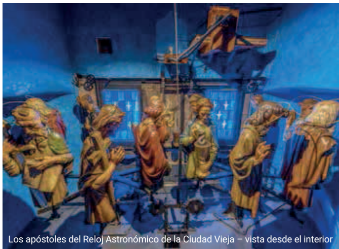
Los apóstoles del Reloj Astronómico de la Ciudad Vieja – vista desde el interior

El Reloj Astronómico se compone de varias partes; además de los cuadrantes astronómico y de calendario, cuenta con el mecanismo de los doce apóstoles, que aparecen en dos pequeñas ventanas al dar cada hora. La capilla en el primer piso del ayuntamiento permite ver el “paseo de los apóstoles” desde el interior.