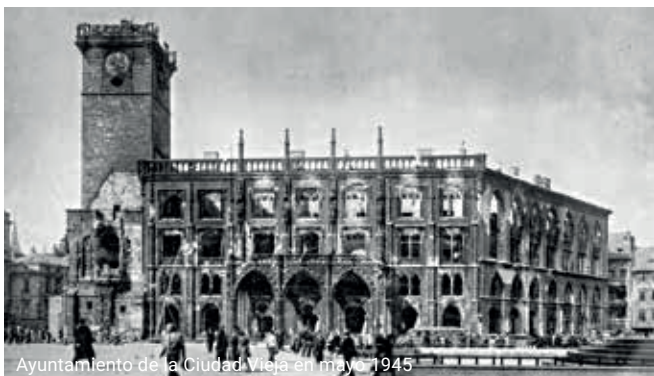
Ayuntamiento de la Ciudad Vieja en mayo 1945

El Reloj Astronómico volvió en gran parte a su forma de preguerra.