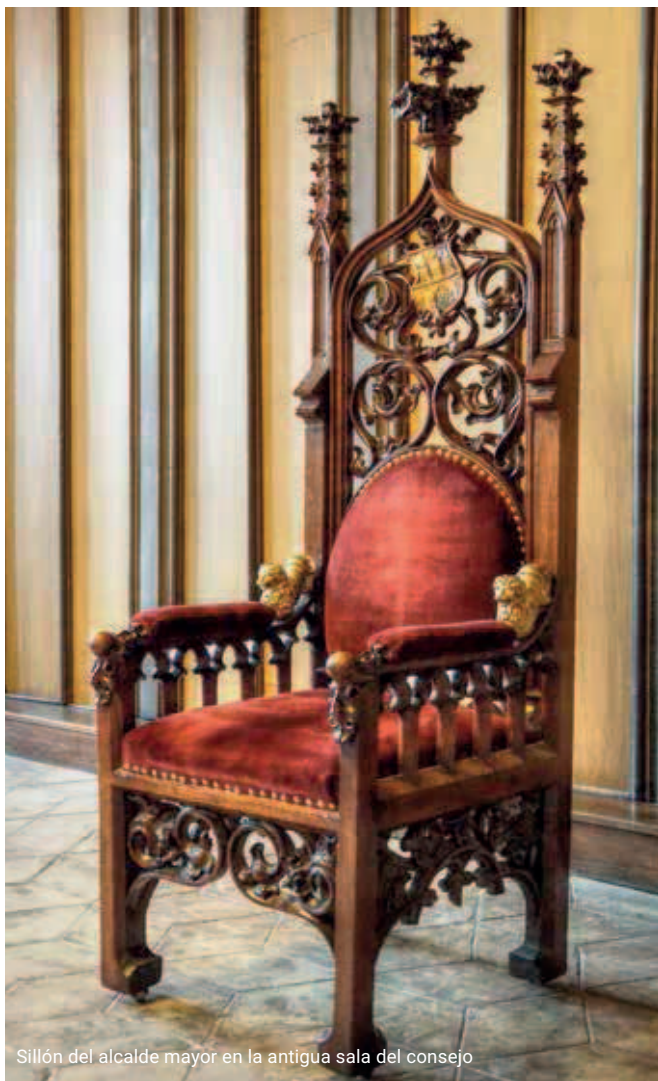
Sillón del alcalde mayor en la antigua sala del consejo

También la antigua sala del consejo es una obra importante de la época gótica. La sala más valiosa del ayuntamiento se ha conservado en su estado original de comienzos del siglo XV. Destaca gracias a su techo de vigas entramadas, su preciosa decoración escultórica y sus históricos muebles tallados. En el pasado fue testigo regular de la asamblea de la junta municipal y del juzgado municipal.