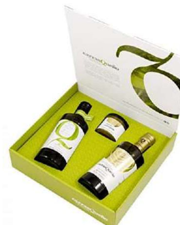
Estuche de regalo de AOVE Carrasqueño 30,00€