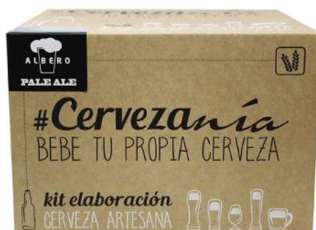
Kit de elaboración de cerveza rubia Pale Ale de Cervezanía 46,66€