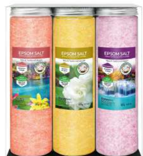
Sales de baño de NortemBio 14,57€