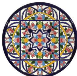
Plato decorativo de cerámica andaluza de Grabado y Cerámica 28,90€