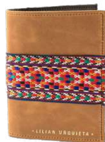
Funda camel pasaporte Verne de Lilian Urquieta 42,00€