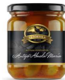
Aceitunas verdes partidas "El antojo de la Abuela María" de La Tórtola del Genil 7,92€