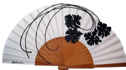
Abanico "Siluetas en flor" pintado a mano de Abanicos DeAnita 39,95€