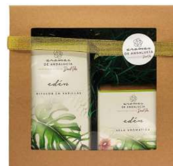
Pack de regalo con ambientador y vela aromática de Aromas de Andalucía 32,90€