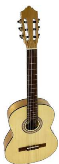
Guitarra flamenca de Antonio Fernández F de Cajones Flamencos 190,00€