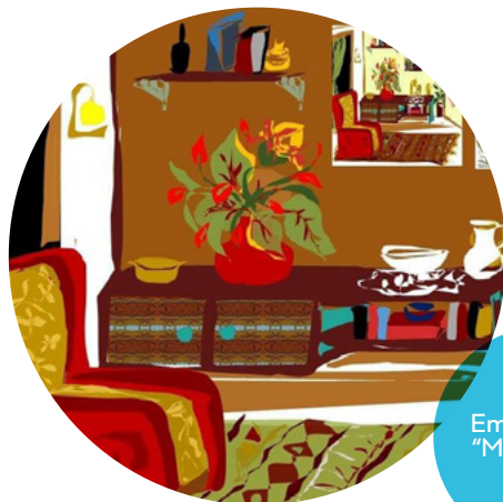
Emilia Ulhoa, "Minha casa"