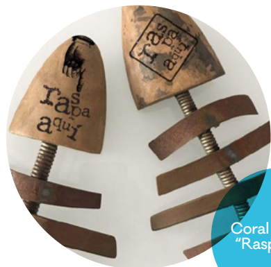
Coral Corona, "Raspa aquí"