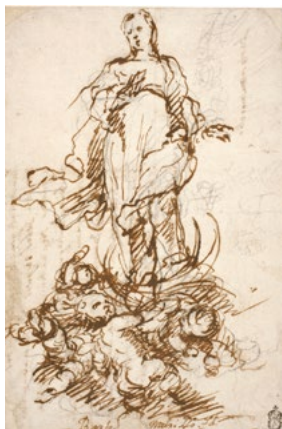
Bartolomé E. Murillo (1617-1682) La Inmaculada Concepción / Fragmento de carta , h. 1662-64. Donación de la Fundación Amigos del Museo del Prado y Coca-Cola España, 1984