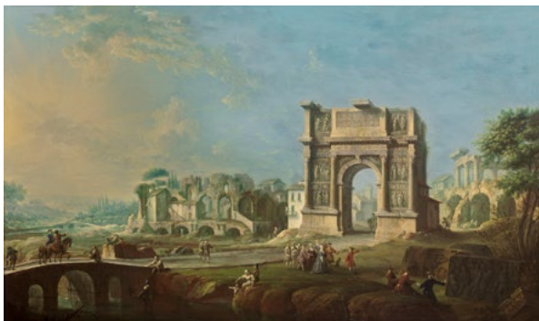
Antonio Joli (1700-1777), Visita de la reina María Amalia de Sajonia al Arco de Trajano en Benevento , h. 1759. Donación de la Fundación Amigos del Museo del Prado, 2011