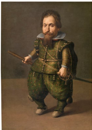
Juan van der Hamen (1596-1631), Retrato de un enano . h. 1626. Donación de la Fundación Amigos del Museo del Prado y la Fundación Bertrán, 1986.

E sta exposición reconoce y rinde homenaje a las decenas de miles de amigos que han brindado su apoyo al Museo, y lo hace reuniendo por primera vez todas las obras donadas por la Fundación Amigos del Museo del Prado y aquellas en cuya adquisición ha participado en sus cuatro décadas de historia gracias a la generosidad de sus miembros.