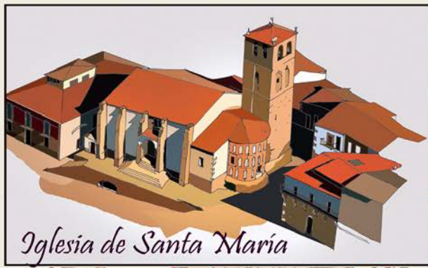
Iglesia de Santa María