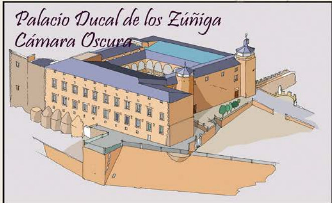
Palacio Ducal de los Zúñiga Cámara Oscura