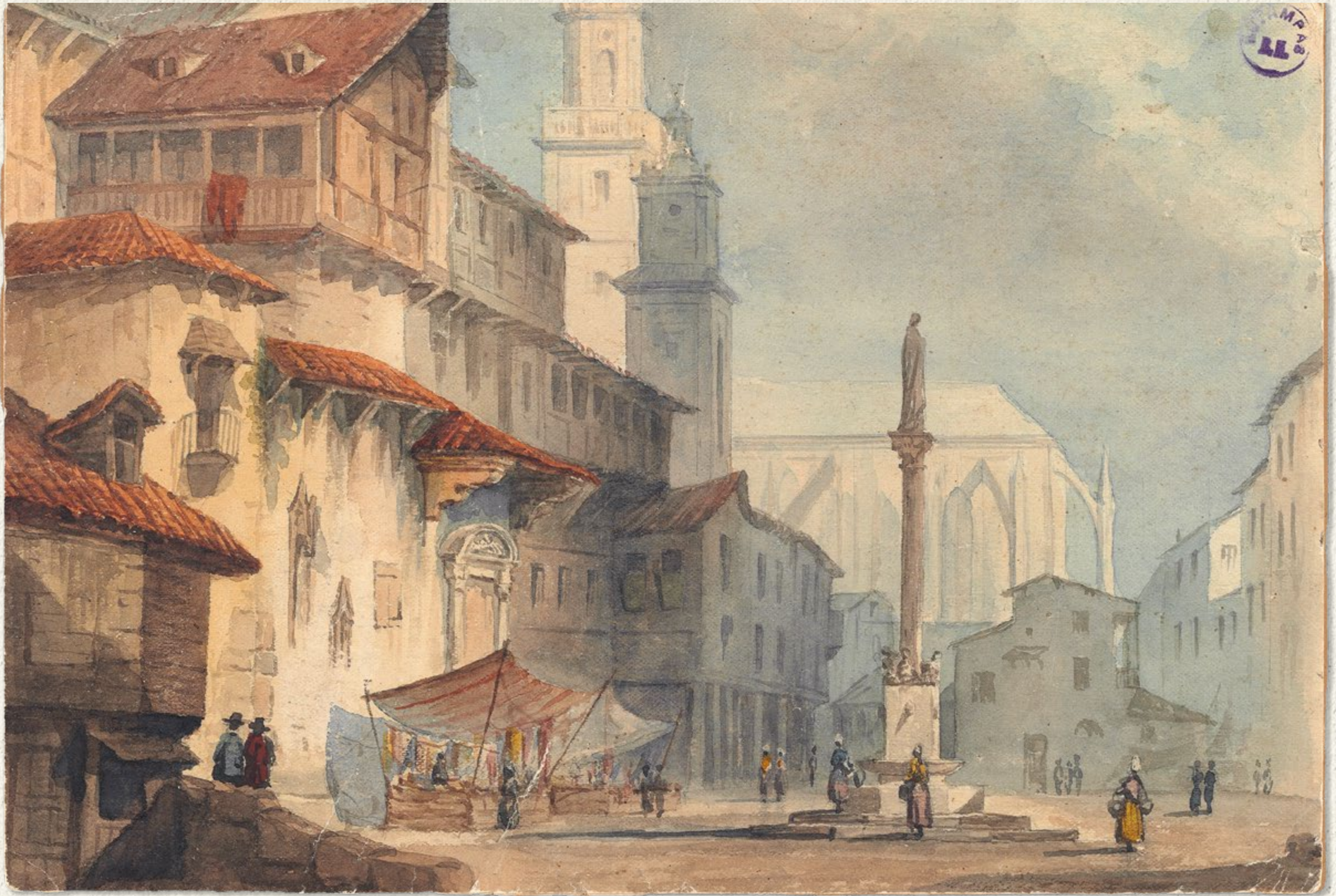
Eugenio Lucas (1817-1870). Plaza con columna, mercado e iglesia gótica al fondo , entre 1868 y 1869. Acuarela sobre papel. BNE, DIB/18/1/493

E igualmente significativos son los textos que Ángel de Saavedra, Duque de Rivas (1791-1865), dedica a la ascensión del Vesubio y a su excursión a los templos de Paestum (1844), que impactan por la elegancia de su estilo y la vivacidad de su prosa.