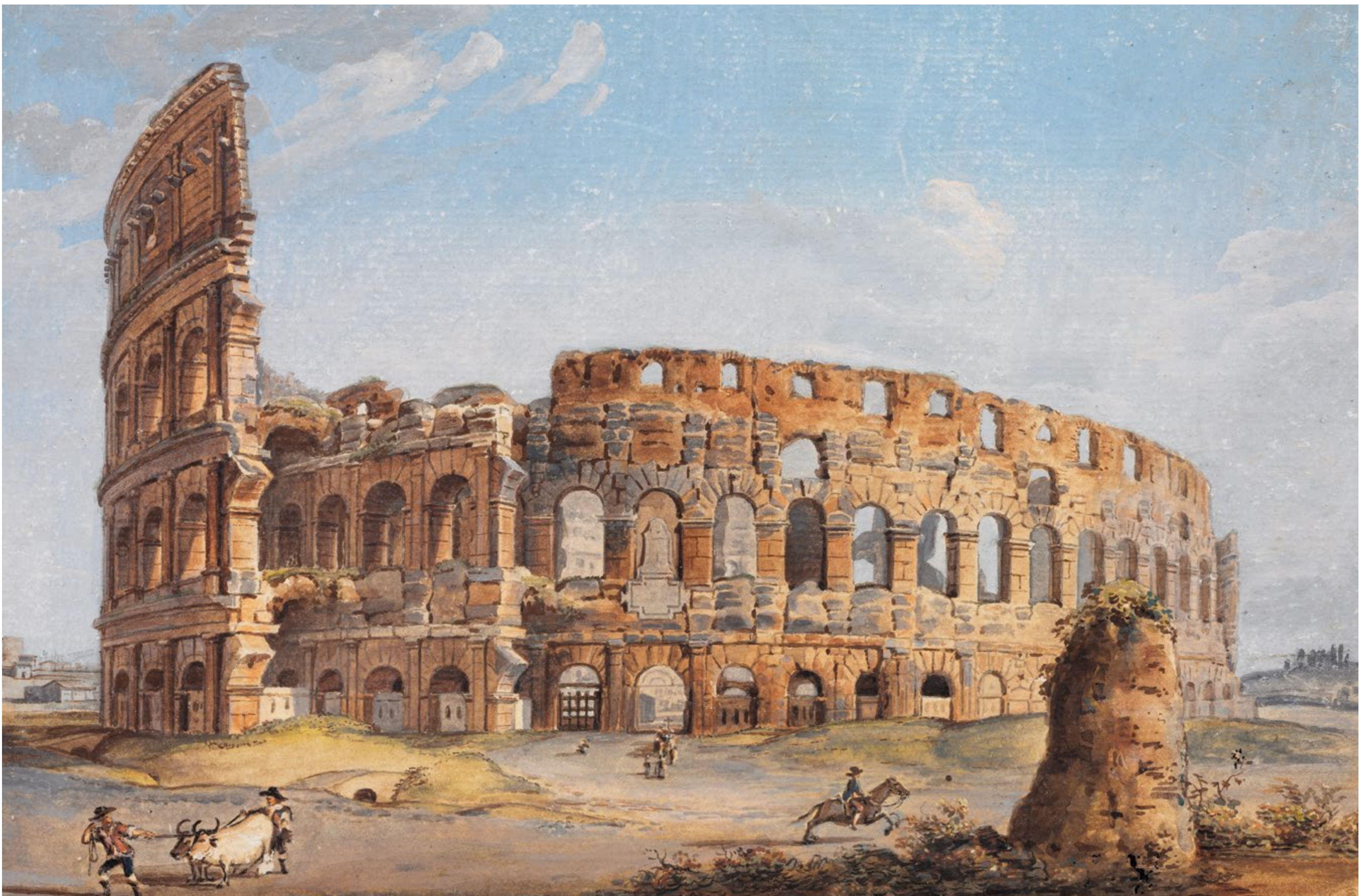
Anónimo italiano (s. XVIII). Vista del Coliseo y restos de la Meta Sudans , 1790. Pastel, gouache, tinta marrón y aguadas de colores sobre papel verjurado. BNE, DIB/18/1/4089

Gracias al mecenazgo de Fernando VI y al sistema de pensiones organizado por la recién inaugurada Real Academia de San Fernando (1752), algunos discípulos de pintura, escultura y arquitectura tuvieron la oportunidad de viajar a la Ciudad Eterna para perfeccionar su instrucción y participar de su ferviente clima cultural.