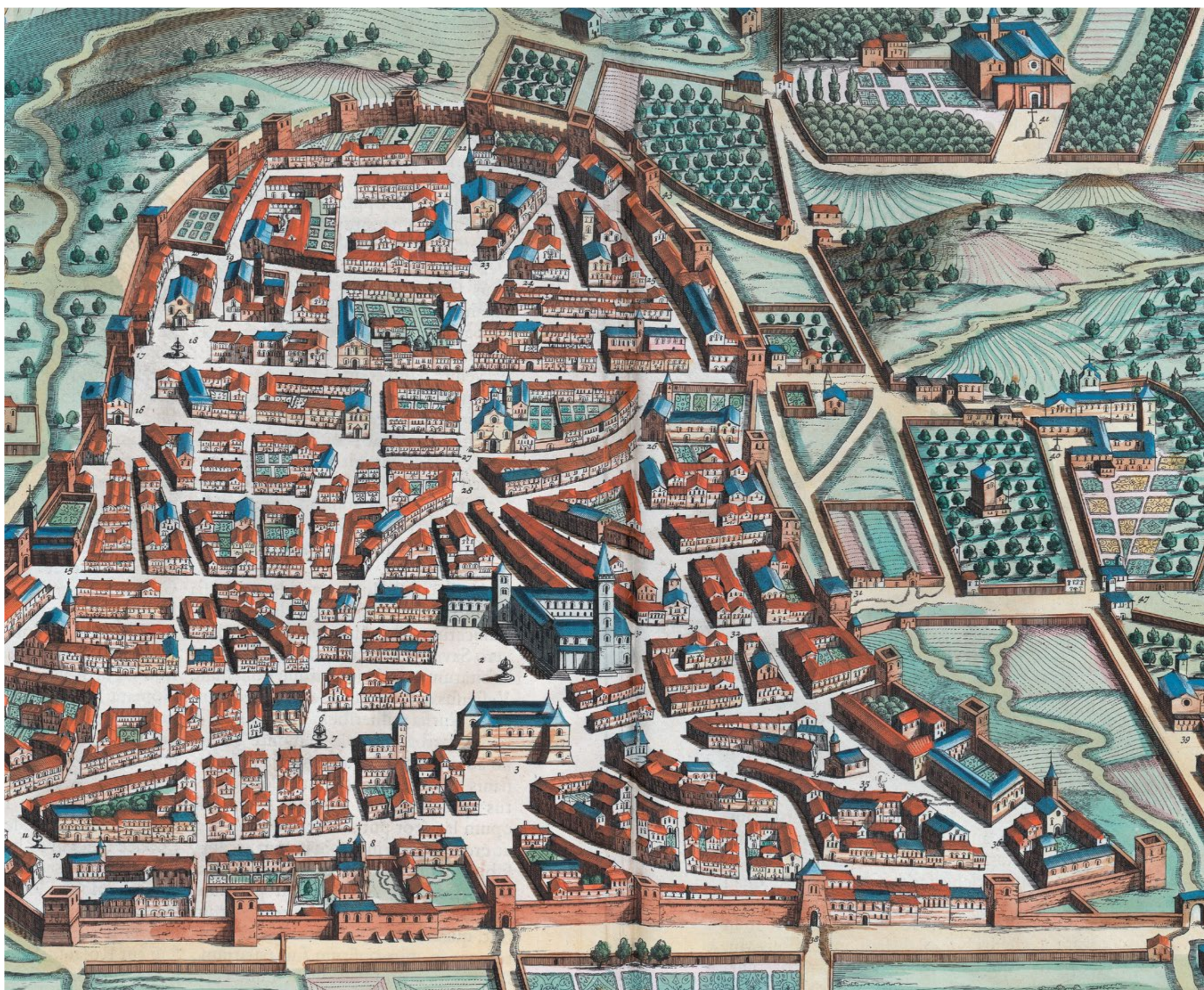
Joan Blaeu (1596-1673). «Vista de la ciudad de Norsia», en Theatrum Civitatum et Admirandorum Italiae, Ad aevi veteris & praesentis temporis faciem expressum , Amstelaedami, 1663. Libro impreso con grabados coloreados. BNE, GMG/258

Las primeras obras en castellano con estas características, es decir, escritas con una finalidad divulgativa, son el Viage fuera de España de Antonio Ponz (1785) y las Cartas familiares del exjesuita Juan Andrés y Morell (1786-1793).