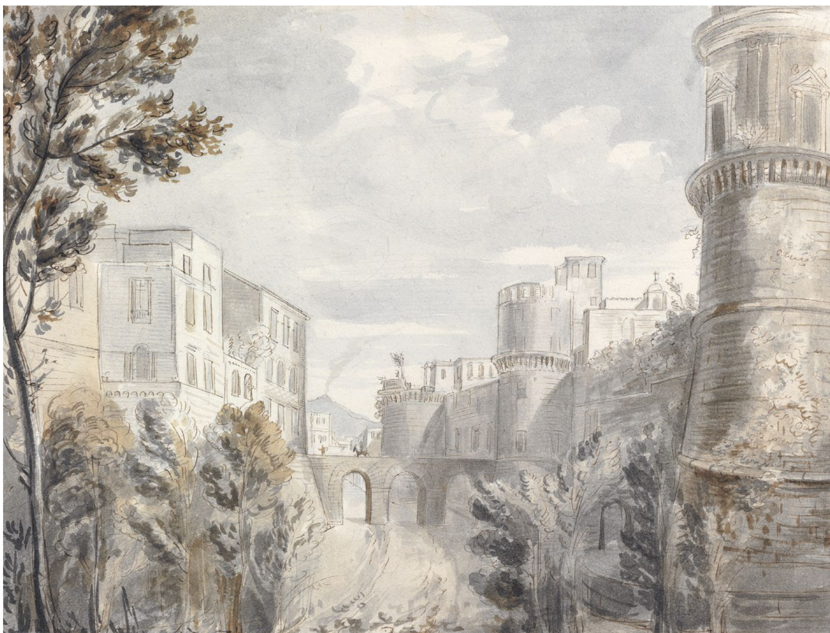
Valentín Carderera (1796-1880). Vista del Ponte Nuovo junto a la Puerta Carbonara, en las murallas de Nápoles , 1825. Pluma, tinta y aguadas de color sobre papel avitelado.

De la primera parte del siglo es muy relevante, también, la experiencia formativa en Italia del pintor osense Valentín Carderera y Solano (1796-1880), como reflejan los álbumes de sus dibujos y acuarelas.