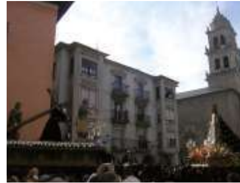
Mamés con un "Cristo articulado en una urna de cristal" (anónimo, s. XV).

16:30 h Sermón del Descendimiento y Procesión del Santo Entierro . Desde la Iglesia parroquial de San