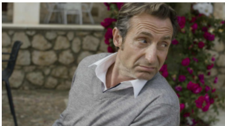
Imagen del cortometraje Vermú (2023), de Néstor López Ferrería