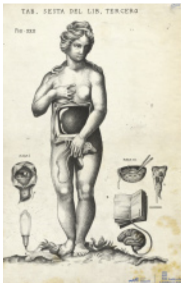
Cartel exposición El médico, el obispo y el pintor

Don Ramón María del Valle-Inclán , por Bravo Teatro