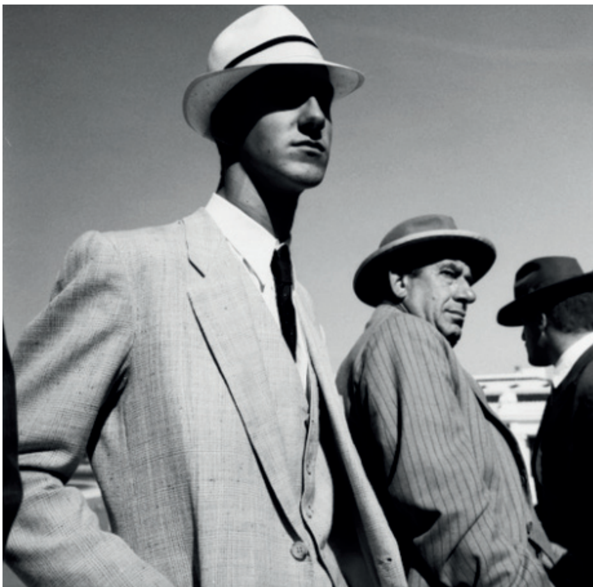
Visionarios (2001), de Sofía Moro .

IV Festival Internacional de Fotografía de Castilla y León Palencia, 17 de abril al 19 de mayo de 2024.