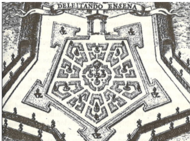
Muestra bibliográfica Deleitando en enseña. La emblemática en el fondo antiguo de la biblioteca