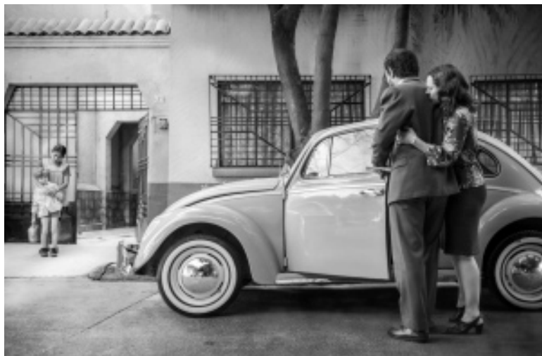
Roma (2018), de Alfonso Cuarón

Museo de la Evolución Humana J 4 - 20:15 h - Salón de actos