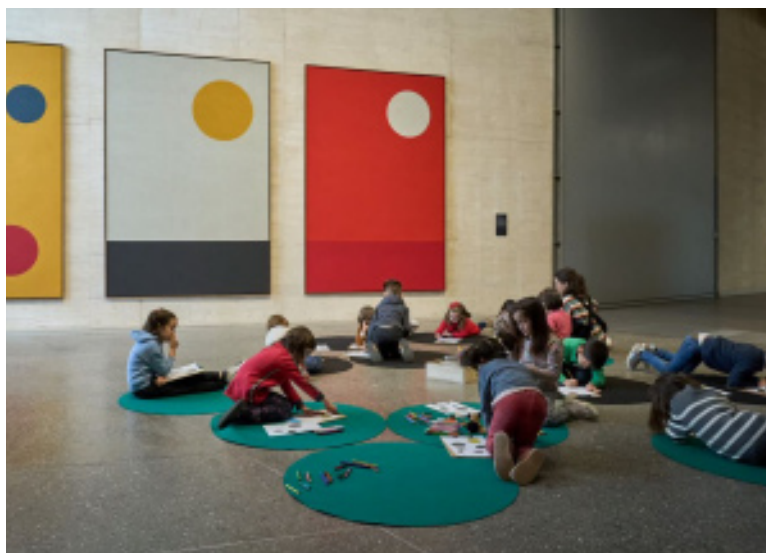
Visita en familia. Exposición Ana Mendieta. En búsqueda del origen