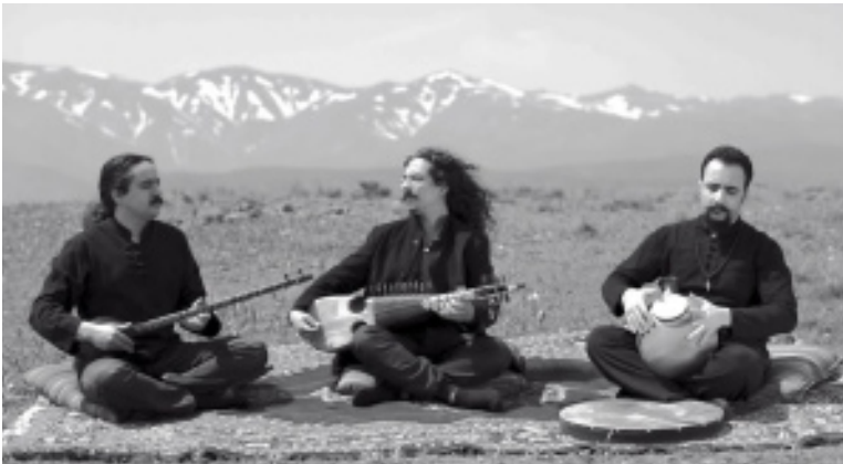
Concierto de Badieh Músicas de la raya afgano-irani