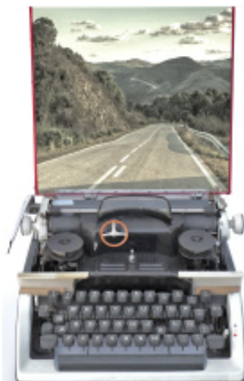
Exposición Cuenta kilómetros . Biblioteca Pública

Biblioteca Pública de Salamanca M 16 - 20:00 h