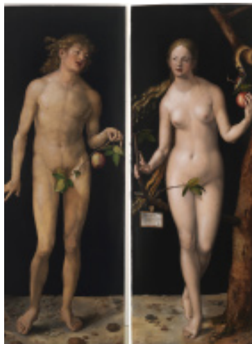
Detalle. Adán y Eva , de Alberto Durero