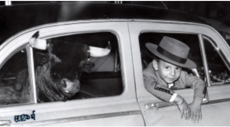
Exposición temporal La memoria taurina. Fotografías taurinas en los Archivos Estatales. Museo Etnográfico de Castilla y León