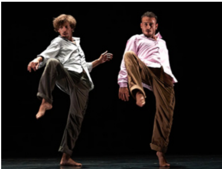
Pasajes. Joven Compañía de Danza