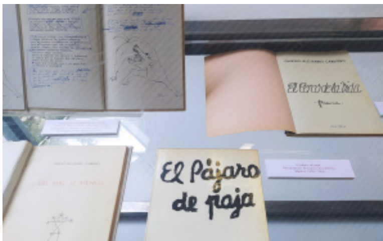
Exposición Gabino Alejandro Carriedo. Integridad y vanguardia

Museo de la Evolución Humana M 2 - 10:45 h - Talleres didácticos