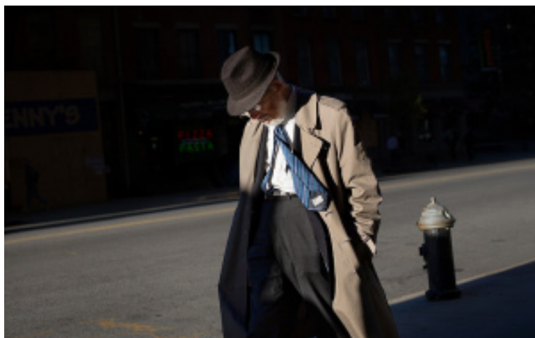
Exposición En medio del tiempo , de José Antonio Carrera. Palacio Quintanar