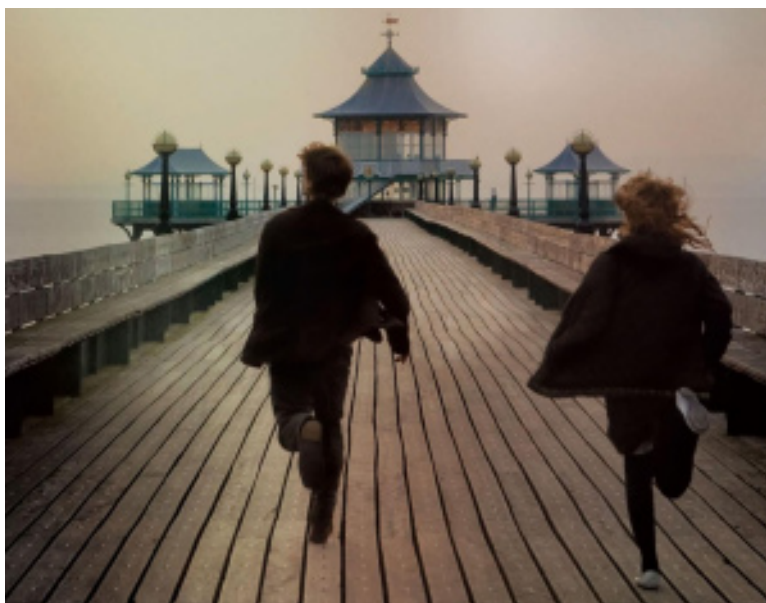
Imagen de la película Nunca me abandones (2010), de Mark Romanek