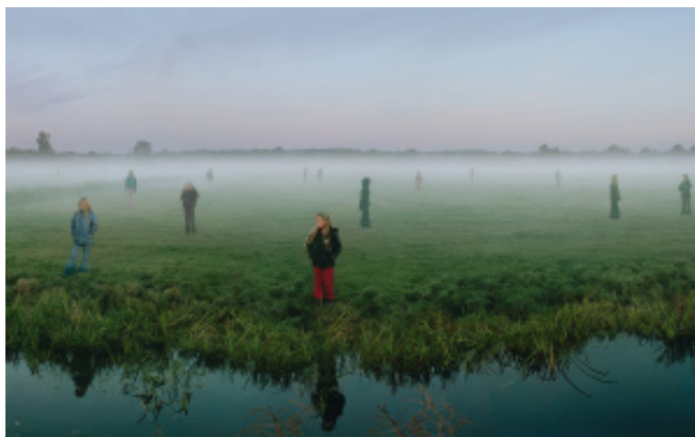
Exposición Fenómenos. Perspectiva para una aproximación a la Colección MUSAC

S 27 - 21:00 h - Teatro Liceo. Salamanca