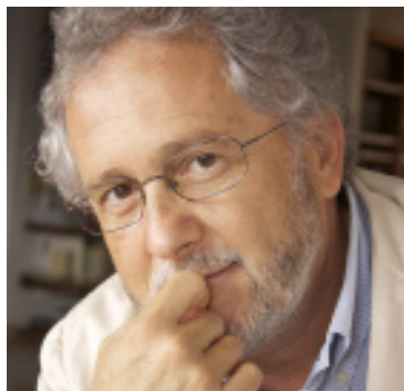
Héctor Abad, escritor