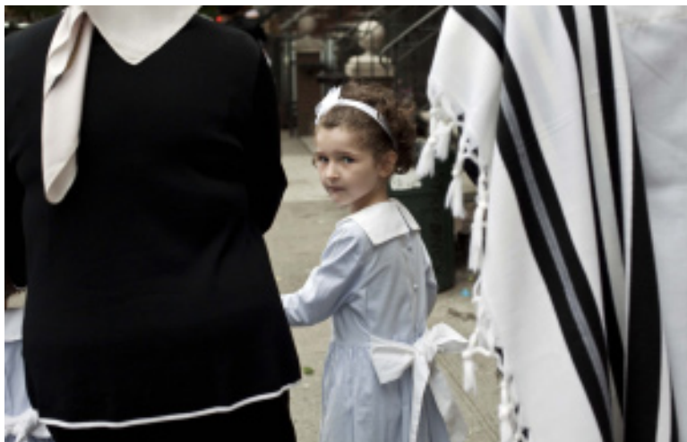
Exposición En medio del tiempo , de José Antonio Carrera. Palacio Quintanar.