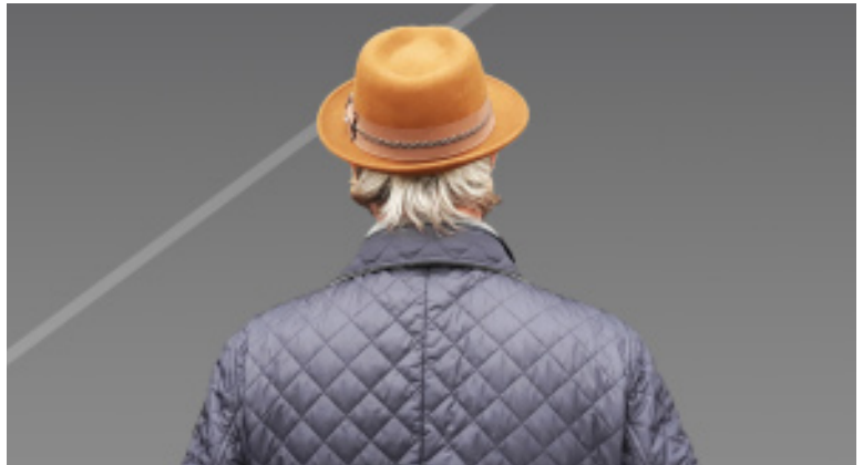
Exposición Regardez! , de Lolo Zapico. Centro Cultural Miguel Delibes

D 7 - 19:00 h - Sala Sinfónica Jesús López Cobos