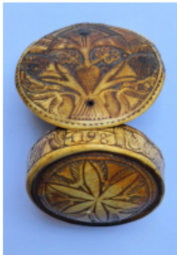
Tabaquera o cajita de rapé. Museo de Valladolid