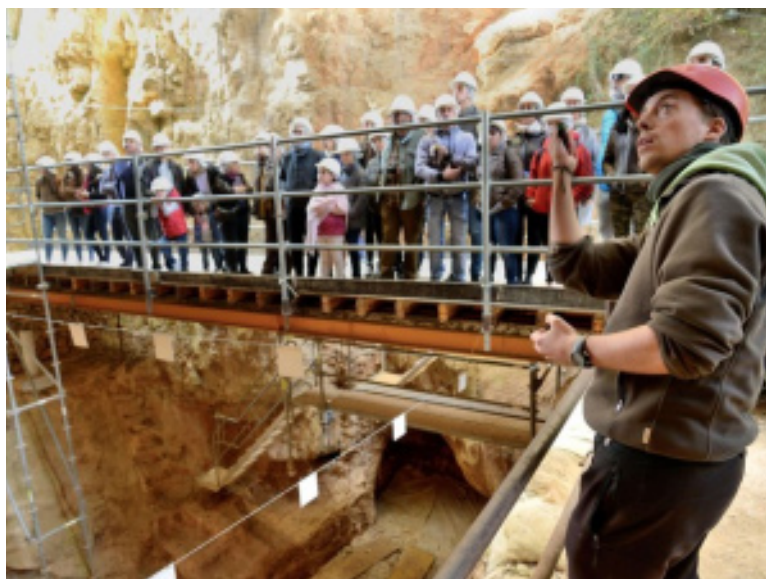
Visita a los Yacimientos de Atapuerca

Biblioteca Pública de Burgos L 29 - 18:30 h - Sala polivalente