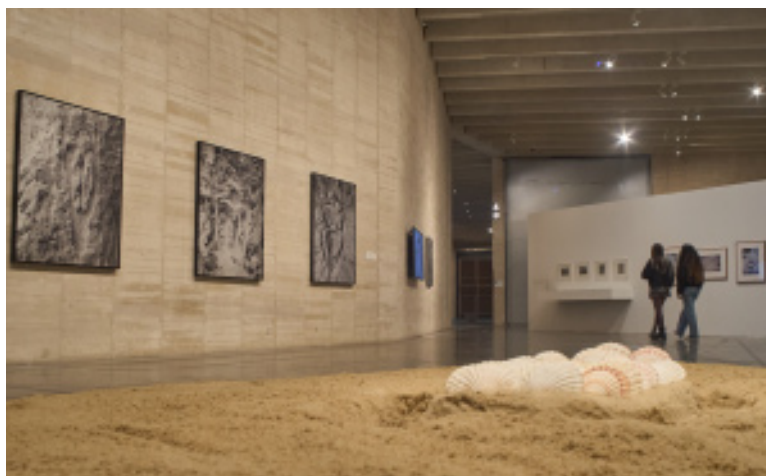
Exposición Ana Mendieta. En búsqueda del origen