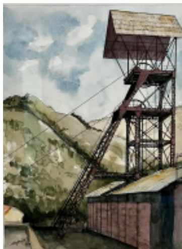
Pozo Herrera, de Eugenio Cagigal.