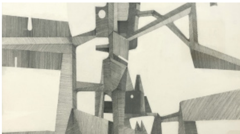
Exposición Néstor Pavón Revisitado. Museo de Burgos