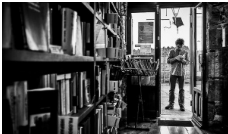
Exposición fotográfica Leyendo en la calle , de Javier Calvo