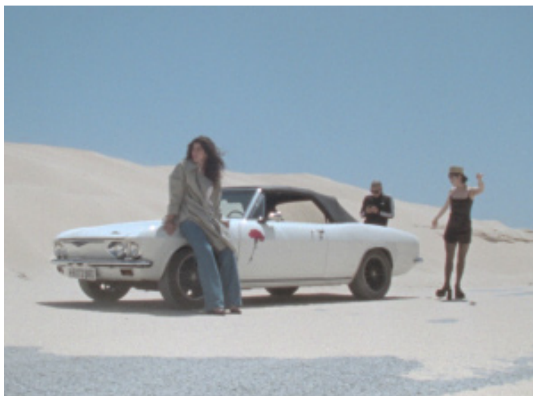
Imagen de la película On the Go