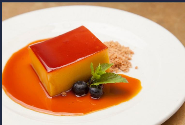
> Cuelga Yemas Tostadas Imperiales

“ Nuestros productos artesanos hacen muy difícil resistirse a creaciones con años de tradición ”