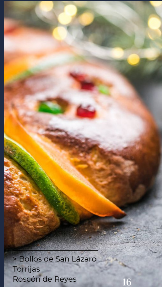
> Bollos de San Lázaro Torrijas Roscón de Reyes