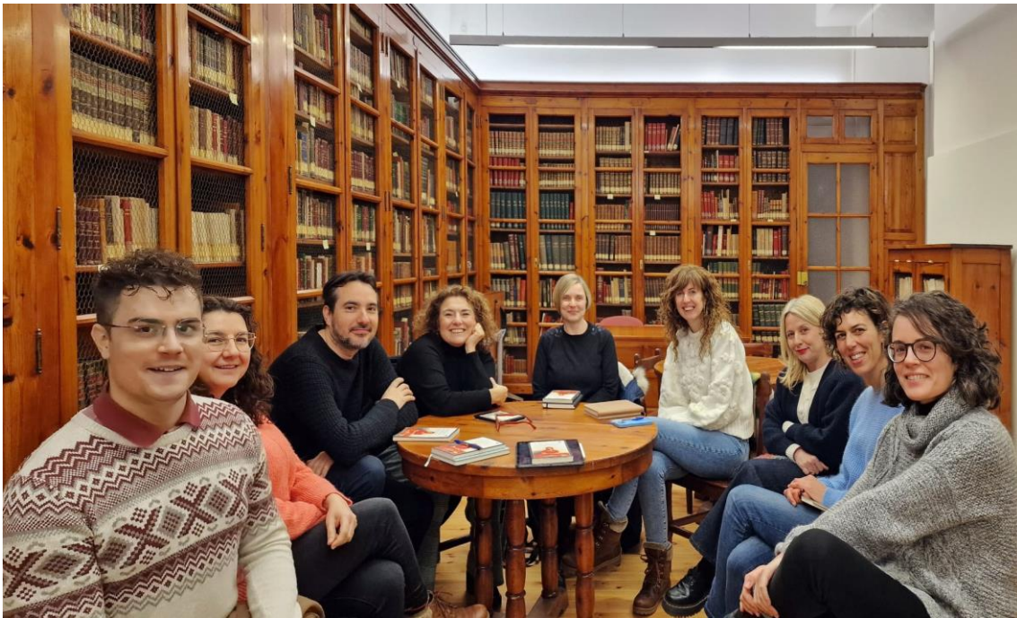
Uno de los encuentros del club de lectura

Información y reserva de plaza: fee.feria.editores@gmail.com