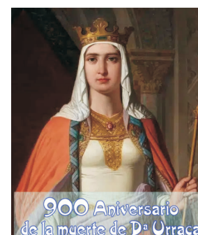
900 Aniversario de la muerte de D. Urraca Urraca I de León (León, 24 de junio de 1081-Saldaña, 8 de marzo de 1126)

SAL150 es una banda de rock-celta de Tarragona, que se consolida en el 2006. La música de SAL150 es fresca y compacta, con un directo dinámico que no deja a nadie indiferente: "Nos gusta conectar con la gente haciendo del concierto una fiesta con temas propios y versiones de temas celtas para bailar y pasarlo en grande".