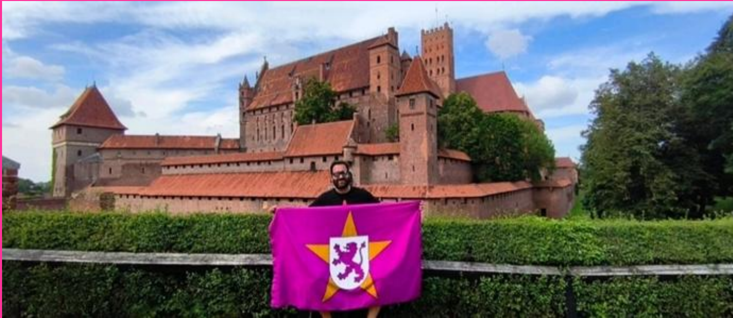
44.Castillo de Makbork. Polonia.