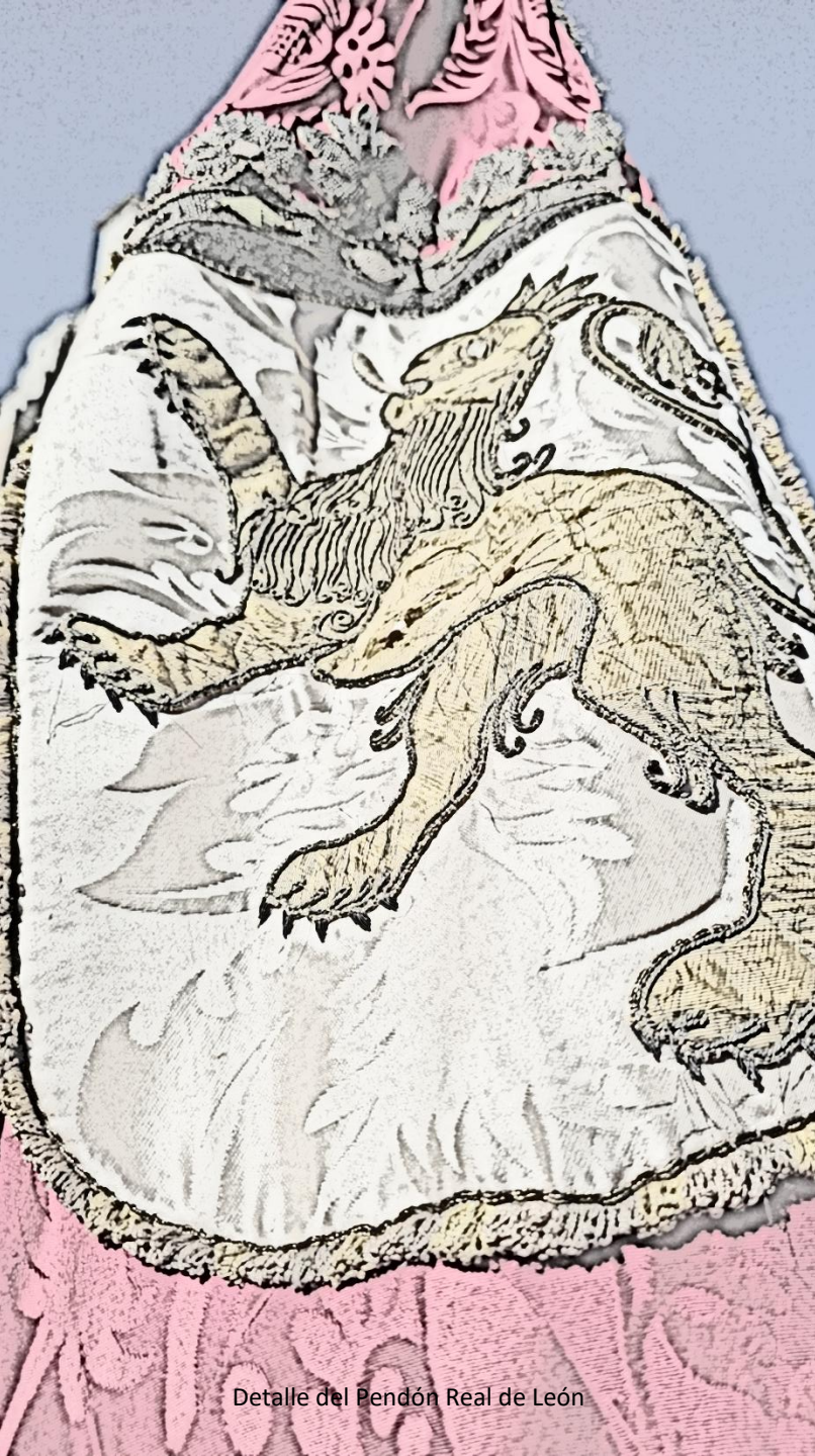
Detalle del Pendón Real de León