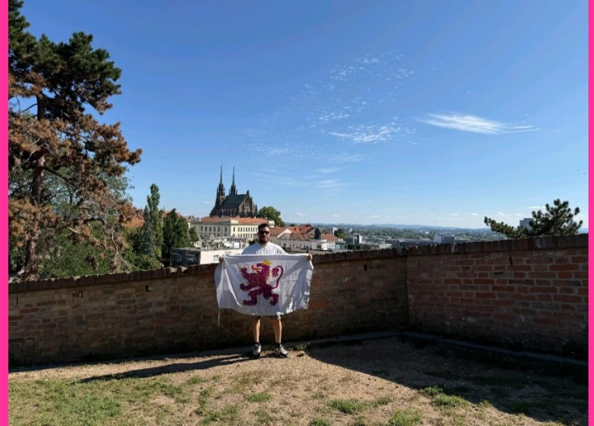
55. Brno. República Checa. Autor: Daniel Barranco