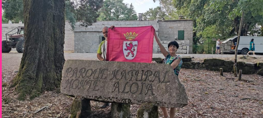
32. Parque Natural de Aloia. Tuy.