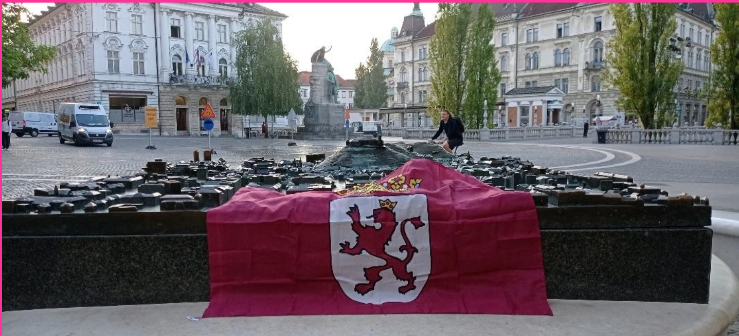
51. Plaza de Francisco Alegre. Lujibiana. Eslovenia.