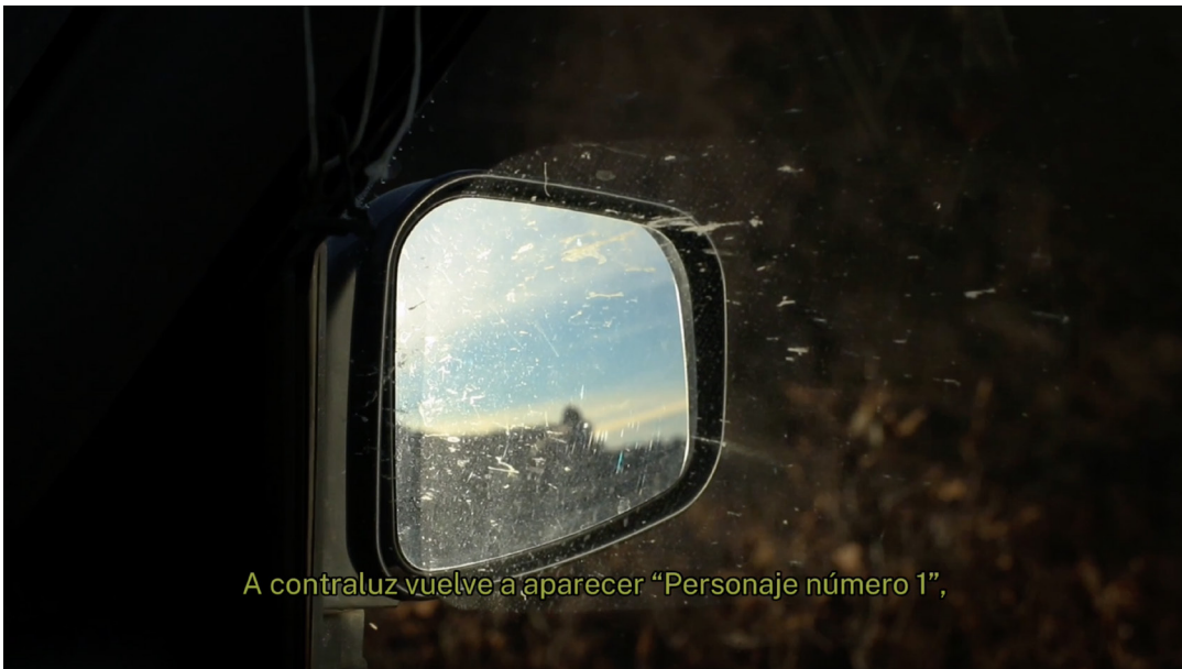
A contraluz vuelve a aparecer “Personaje número 1”,