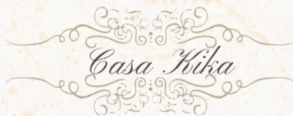
Mónica López Restaurante Casa Kika

19:00 h - Showcooking a cargo de Casa Kika "Quesos artesanos leoneses como base de salsas de cocina internacional" (invitación).